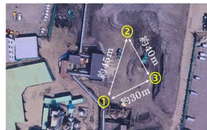
図 1 試料採取位置

堆積場下層部で長期にわたり堆積してある部分からアスファルト性状試験に必要な試料を、図 1 に示す①、②、③の 3 点からボーリングにより採取した。また、比較のために堆積場に搬入されて間もないアスファルト発生材（以下：搬入ガラ）も試料とした。